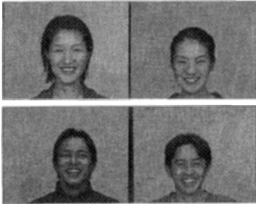
図 3-4：ジョーク文を読んだ際の笑顔の例

(17) 私の母方のおばあちゃんの話です。お医者さんに行き、「お尻に入れなさい」と渡された座薬を、おばあちゃんはお汁に入れて飲んでしまいました。